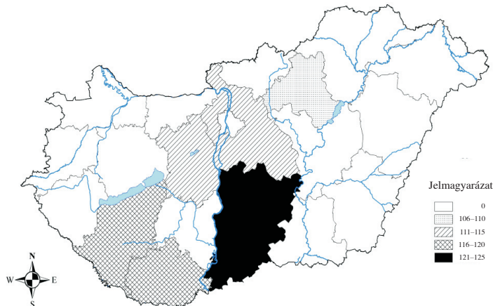
Figure 2. Average length of phenophase sprouting – harvesting of apricot in Hungary (1983–92) (0 = no data)

A termésképzéshez szükséges (rügyattanás–szedés kezdete) időszak meteorológiai viszonyai. A részletesebb vizsgálat céljából ezt az időszakot a következő két fázisra bontottuk: rügyattanás–teljes virágzás (első fázis) és teljes virágzás–szedés kezdete (második fázis). Az első fázis átlaghőmérséklete a vizsgált évek átlagában 8,2–9,9 °C, a másodiké 15,5–16,9 °C, a teljes periódusé pedig 14,3–15,9 °C volt, de a rügyattanás–szedés kezdete