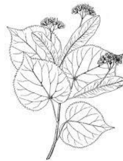
kislevelű hárs leveles, virágos hajtása

A temetődombi fa kislevelű hárs. A faj Európában, és azon belül Magyarországon is honos. Tölgygel, gyertyánnal összefogva nagy területeket hódítottak meg, erdősítettek be a Dunántúlon és az Alföldön is. A szökedencsi hársnak nem kellett nagy utat bejárni, hogy ide kerüljön. Szülei a környék erdeiben élhettek annak idején. Nagylevelű testvére ( Tilia platyphyllos Scop.) a vizesebb élőhelyeket, ezüstlevelű testvére ( Tilia tomentosa Desf.), pedig a szárazabbakat kedveli jobban. A kislevelű hárs nem a dombságok, inkább a hegyvidékek növénye, de az ilyen szökedencsi, meszes talaj igen kedvére való. Gyökere mélyre hatoló, töve gyakran sarjad. Nagy kort képes megélni. Elődeink is kedvelték. Főleg virágának nektárja, terméséből főzött teája, faragható fája miatt. A templomok oltárát díszítő faragások, szobrok is hársból készültek.