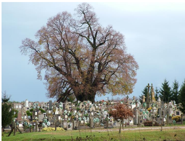
a szőkedencsi hárs

Híres még bajmóci társa, mely alatt egykor Mátyás pihent és egy okmány tanúsága szerint II. Rákóczi Ferenc fejedelem címzett oklevelet, ilyen formán: „Datum sub tilia nostra Bajmocziensis”. A Felvidéken álló, beteges, nagy öreg átmérőjét már meg sem lehet mérni. Talán a legnagyobb fatestvér a németországi Heedebeben él. Korát csupán 500-650 évre becsülik, de körmérete hatalmas, 16 méter.